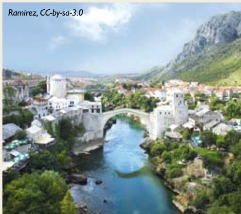
Eines der Siegerfotos

Alle Siegerfotos unter: http://commons.wikimedia.org/wiki/Commons:POTY/2010