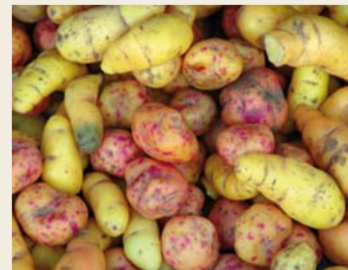
Eric Hunt, CC-by-sa 2.5