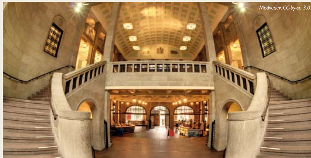
Eingangsbereich des Museums für Hamburgische Geschichte.

Wikipedia-Artikel erstellt, dann ausgedruckt, laminiert und einfach an das Ausstellungsstück angebracht. QRpedia ermöglichte dabei das Erkennen der Sprachversion jedes Smartphones, über das ein Artikel zu einem Ausstellungsstück abgerufen wurde. Besucher erhielten so direkten Zugriff auf den Wikipedia-Artikel in ihrer Muttersprache. Gab es einen Artikel nicht in der nötigen Sprache, zeigte QRpedia eine Liste mit alternativen Sprachversionen an. Mit QRpedia können Museumsbesucher also auf sprichwörtlich einen Blick den Wikipedia-Artikel des Kunstwerks lesen, vor dem sie gerade stehen.